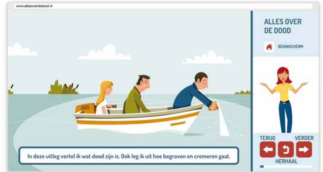
Een printscreen van de website 'allesoverdedood.nl'

viel mij op dat ze er zo fijn en makkelijk over konden praten. Ze vertelden over hun ervaringen met dood en rouw en gaven aan het prettig te vinden als ze hulp zouden krijgen bij het bedenken van wensen voor hun eigen uitvaart. Of tips over hoe zij iemand anders die verdriet heeft, kunnen helpen. Heel nuttig voor ons, maar het waren vooral ook mooie gesprekken. Dat gun ik