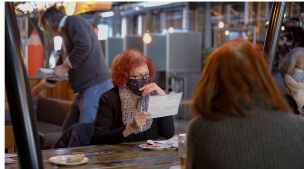
Afbeelding 4: Deelnemer in gesprek met één van de onderzoekers (links). Deelnemster bekijkt haar stempluspas (rechts).