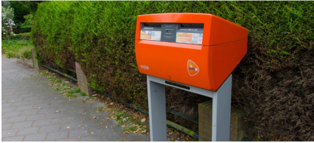
Afbeelding 5: Brievibus (ter illustratie).