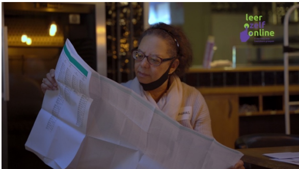
Afbeelding 3: De omvang van het stemformulier leidt soms tot problemen bij het weer invouwen en passend maken voor de iets te krappe briefstemvelop.