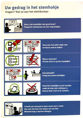
Afbeelding 4: De instructie in het stembokje werd niet gezien en was onduidelijk.