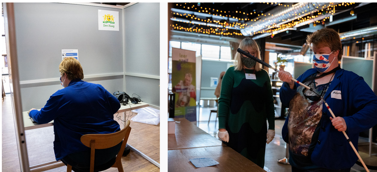
Afbeelding 5: Slechtziende deelnemer tijdens het stemmen.