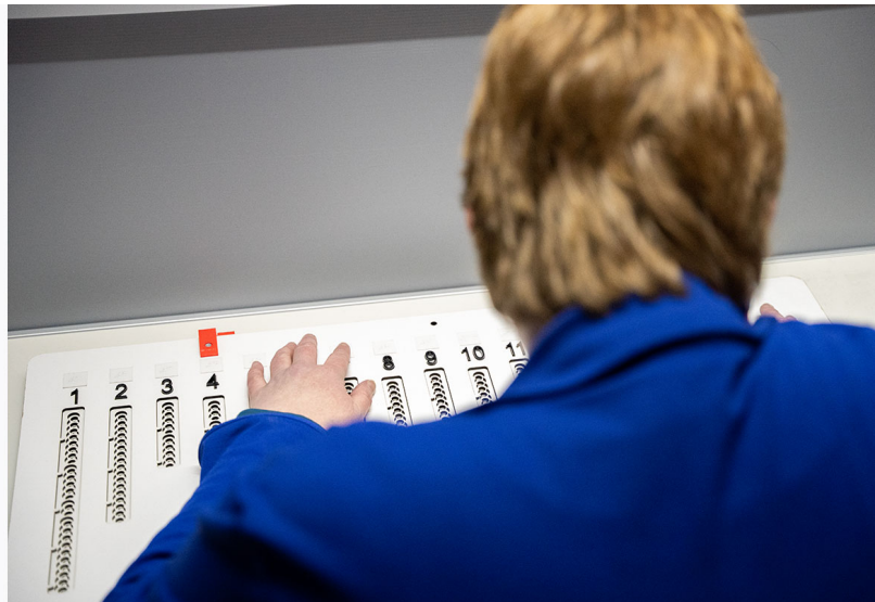
Afbeelding 7: Een slechtziende deelnemer met zijn geleidehond (links) en slechtziende deelnemster aan het werk met de stemmal (rechts).