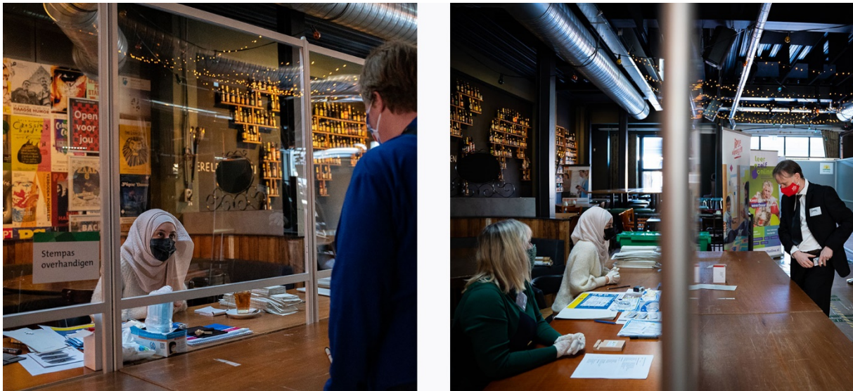
Afbeelding 3: Deelnemers bij het stembureau.