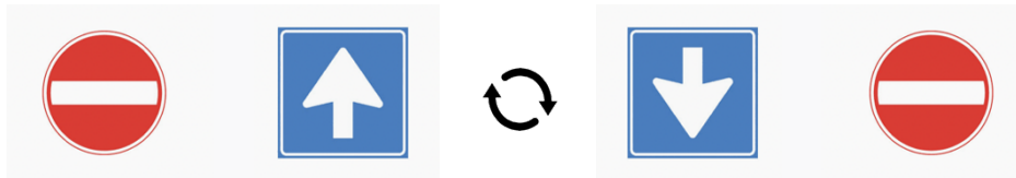
Afbeelding 9: Een ‘verbodsbord’ heeft wanneer het op de vloer is geplakt ‘geen richting’.