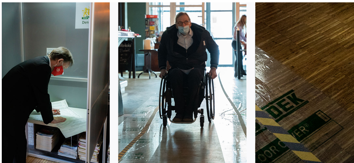
Afbeelding 8: Stemmen in een stemhokje met een laag werkblad (links), de loop/rijrichting is niet duidelijk (midden) en de voor slechtzienden moeilijk te voelen geleideband (rechts).

Bij de deelnemers met een lichamelijke beperking speelden heel andere, vaak praktische, problemen de belangrijkste rol. Zo werkte de tactiele geleidebanden om de looproute te volgen niet en waren er problemen met het plaatsen van het formulier in de stemmal en het tonen van het identificatiebewijs.