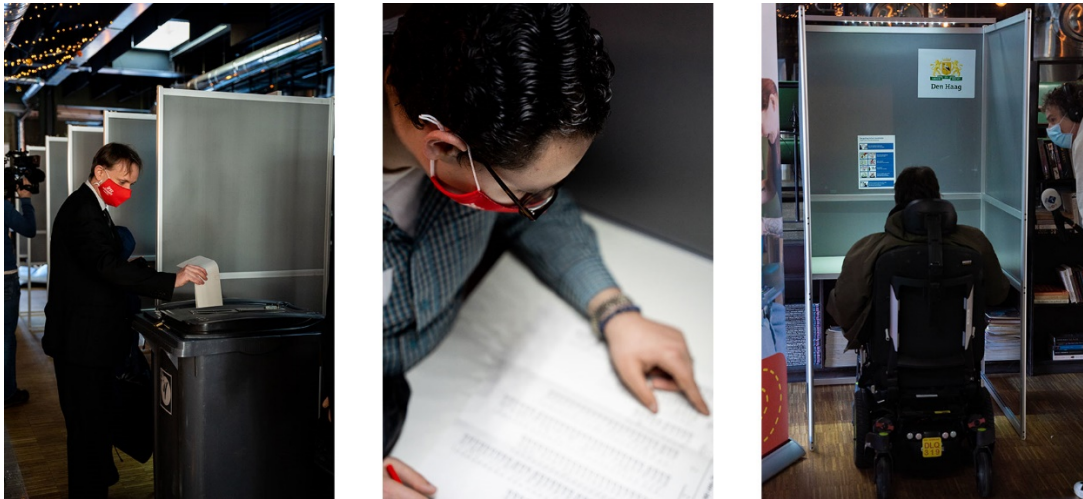
Afbeelding 1: Drie deelnemers met een beperking tijdens het ochtendprogramma.